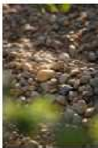
波拉美地区特有的砾石土壤

永葆青春的Caudalie 每年6月的清晨，葡萄花开的时节，是酿酒人最喜爱散步葡萄园的时刻。清新空气中飘散着淡雅宜人的葡萄花香，卡吉亚夫如的女儿用父亲酒庄的葡萄渣做实验而发现葡萄籽内富含丰富的多酚，于是她与丈夫创建了法国著名纯天然名牌——Caudalie，将葡萄中的精华与葡萄花独一无二的芬芳加入每个产品当中，受到法国女士的疯狂追捧。他们更在酒庄对面开辟5公顷土地作为葡萄精化理疗中心，将葡萄的精