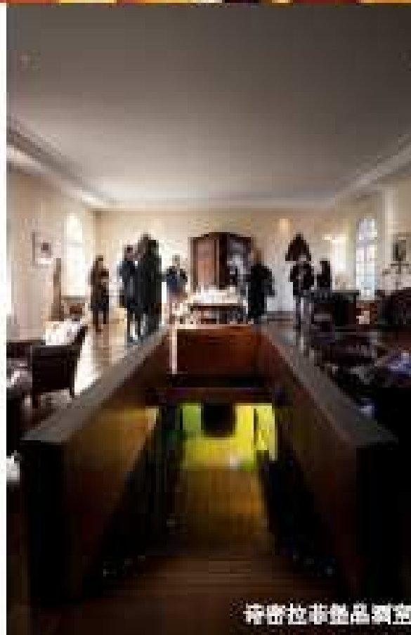
奇密拉非精品酒庄

华与泉水结合起来，为您带来一段奇妙的SPA之旅。这是参观酒庄不得不尝试的一番新奇体验。